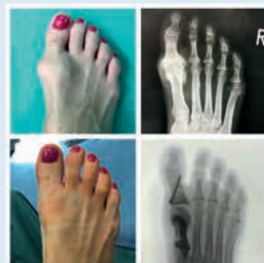
Bei der Hallux-rigidus-OP nach M. Rahmanzadeh wird das Gelenk immer erhalten und nicht versteift. Obere Reihe: vor OP, untere Reihe: nach OP