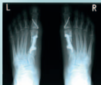
oben: Röntgenbefund vor der Operation; unten: Beidseitige Korrektur mit Hallux-Platte nach Rahmanzadeh

reduziert wird und somit die Schmerzen verursachende Entzündung beseitigt wird.